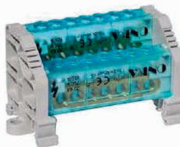
Suojattu PE-/N -kiskopaketti 160A max 25mm²